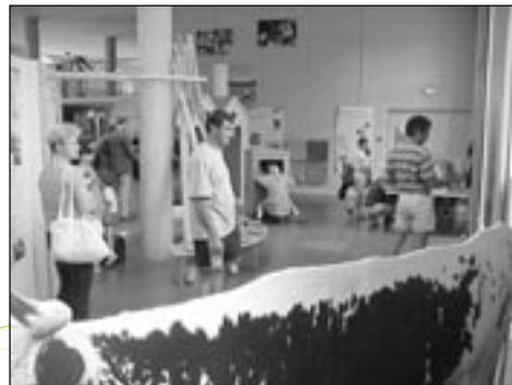
Exploitation agricole du massif