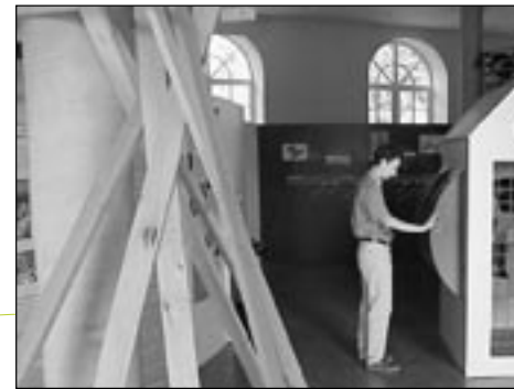
Industrie : usine à images