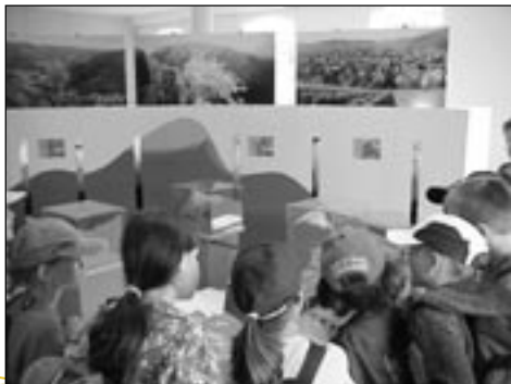
La maquette du territoire