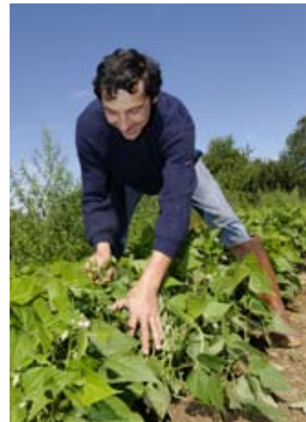
La ferme auberge la Chenevière à Plombières-les-Bains

Le Parc naturel régional des Ballons des Vosges a également inscrit la valorisation des productions agricoles dans sa 3 e Charte. Le syndicat mixte est intervenu ces dernières années en étudiant différentes problématiques: les freins à l'installation ou les dynamiques locales autour de la vente en circuits courts. Le travail se poursuit désormais par le partage de ces expériences et l'accompagnement de nouvelles initiatives telles que un marché paysan numérique (une initiative de la communauté de communes de la vallée de Kaysersberg) ou encore les producteurs de Kirsch à Fougerolles pour redynamiser ce savoir-faire suite à l'obtention d'une AOC (Appellation d'Origine Contrôlée). Autre création à l'étude: une filière locale d'approvisionnement en myrtilles sauvages avec les fermes-auberges et restaurateurs des Hautes-Vosges.