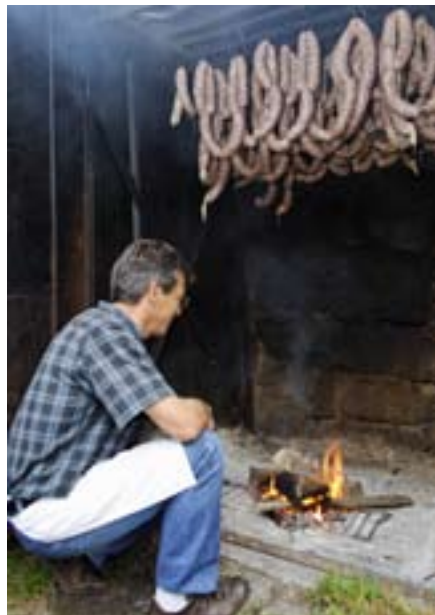
La ferme auberge les Grands Prés à Plainfaing

pics de productions alors que l'entreprise ne peut pas encore embaucher ». Le rôle des chambres consulaires et des organismes de formation est essentiel. Ils peuvent intervenir pour des études de marché, de la formation continue pour les porteurs de projets, ou encore accompagner le financement d'outils individuels (vitrine réfrigérée) ou collectifs (abattoirs de proximité).