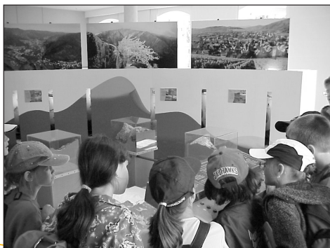
La maquette du territoire