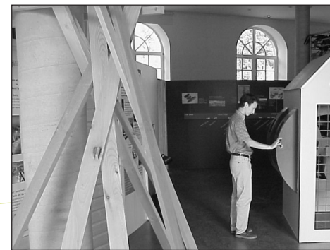
Industrie : usine à images