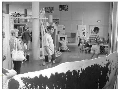
Exploitation agricole du massif